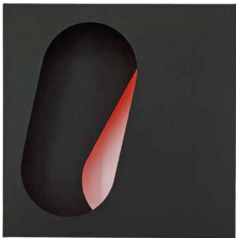
Reinhard Wöllmer, „Farbraumrelief, Schwarz, Mai. Nr.2“, 2016

Mit der Ausstellung regarding: paper werden zeitgenössische Positionen vorgestellt, in denen Papier als Arbeitsmaterial eine wesentliche Rolle einnimmt. Das Medium Papier ist in unterschiedlichen Ausprägungen in der aktuellen Kunst präsent, eine beachtliche Spannweite wird von vier Künstlerinnen und Künstlern im Oberpfälzer Künstlerhaus vertreten sein.