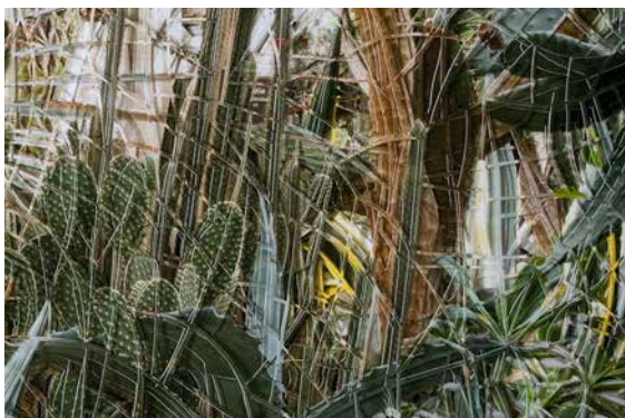
Nicola Müller, „Cut Out Chicago“, 2015, 106 x 150 cm, 8 Schichten Fotoprint (Detail)